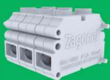
Conector de cabos modular